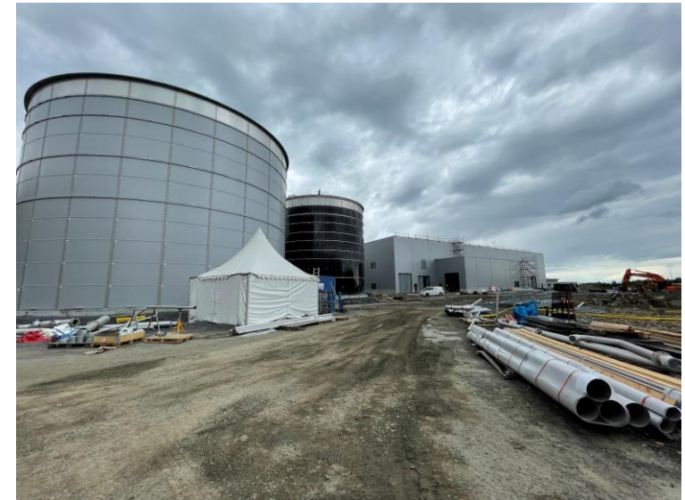
Översiktsvy, RRL till vänster