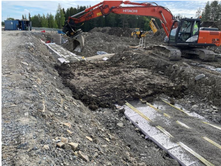
Fyllning och packning kring gasledningar