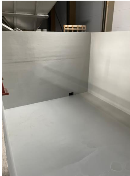
Tätskikt i mottagningsficka