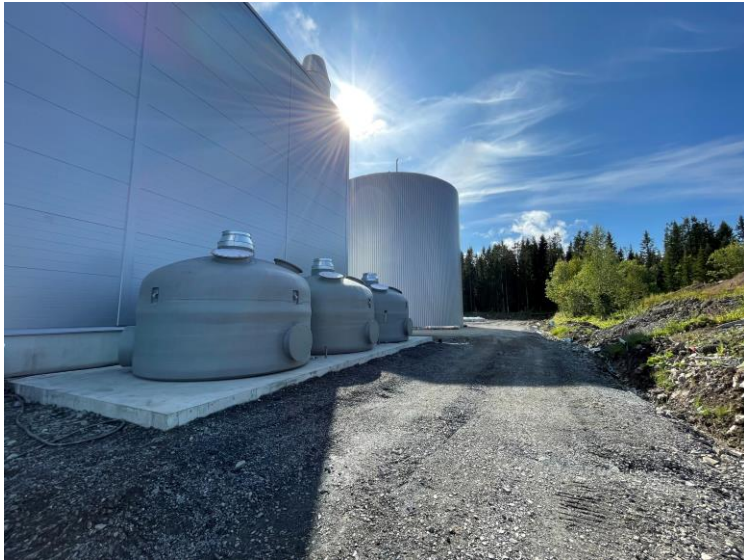
Kolfilter på baksida av processhall